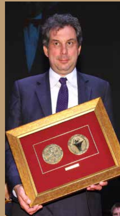
WYDAWNICTWO HERDER Z FRYBURGA (NIEMCY)

za wydobywanie niezmienniej istoty Sacrum z materii i ożywianie jej w ludzkich sercach, duszach i umysłach