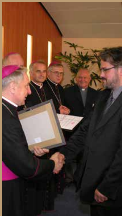
PRACOWNIA WITRAŻY „FURDYNA” Z KRAKOWA

za szczególny wkład w rozwój sztuki sakralnej