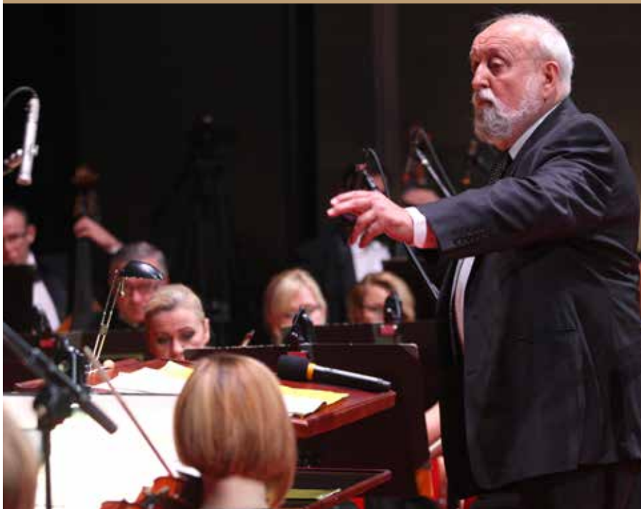
PROF. KRZYSZTOF PENDERECKI (1933-2020)

POLSKI KOMPOZYTOR, DYRYGENT I PEDAGOG MUZYCZNY